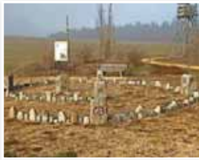
Flurneuordnung Liptingen: Das Napoleonische Dreieck mit diversen Grenzsteinen