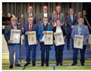
Ehrungsabend mit den Geehrten beim Gruppenbild